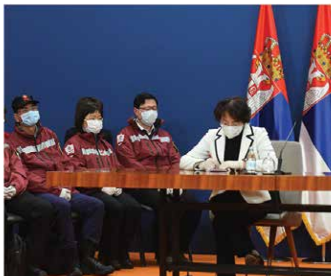
Kineska ambasadorica u Srbiji i medicinski tim iz Kine.

Istorijski vrhunac u kinesko-srpskim odnosima postignut je 2016. godine potpisivanjem Sveobuhvatnog strateškog partnerstva – najvišeg nivoa partnerstva koje jedna država može imati sa Kinom – tokom prve i jedine posete kineskog predsednika Si Đinpinga Srbiji (i Zapadnom Balkanu uopšte). Kina uglavnom uvećava svoj nivo saradnje sa određenom državom onda kada proceni da je postignuto političko poverenje i pozitivan rezultat u dosadašnjoj saradnji. 8 Kako Sveobuhvatno strateško partnerstvo predstavlja sporazum sa najvećim simboličkim značenjem za Kinu, njegov je cilj da saradnju učini „višedimenzionalnom, širokog raspona i višeslojnom.“ 9 U slučaju Srbije i Kine, u dokumentu je ponovljeno ono što je navedeno u Strateškom partnerstvu iz 2009. godine, sa ohrabivanjem dalje komunikacije, saradnje i koordinacije u političkim, ekonomskim i međuljudskim aspektima bilateralnih odnosa.