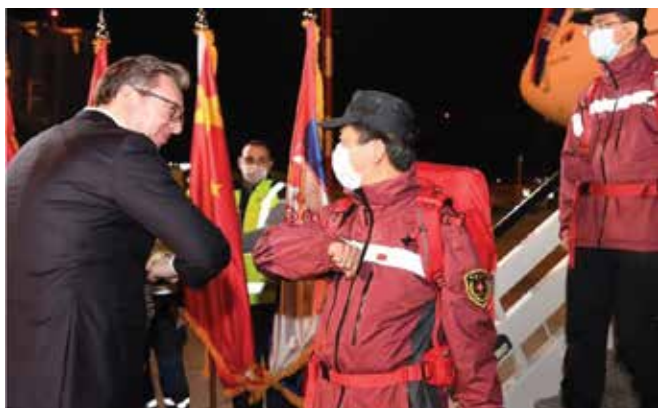
Srpski predsednik Aleksandar Vučić dočekuje kineske zdravstvene stručnjake i avion sa medicinskim materijalom u Beogradu 21. marta.

Uzevši sve u obzir, dokazi snažno upućuju na to da je trenutni nedostatak verodostojnog opredeljenja za članstvo u EU prevashodno rezultat delovanja srpskih zvaničnika, a ne uticaja spoljnih aktera poput Kine. Istovremeno, nedavni događaji potvrdili su da je Kina spremna da iskoristi svaku šansu koja joj se pruži da uveća svoju prisutnost u Srbiji, odnosno onoliko koliko EU to dopusti. Dakle, ukoliko se gleda napred, što više ekonomskog i političkog kapitala EU uloži u Srbiji, to će manje prostora biti ostavljeno Kini da proširi svoj uticaj.