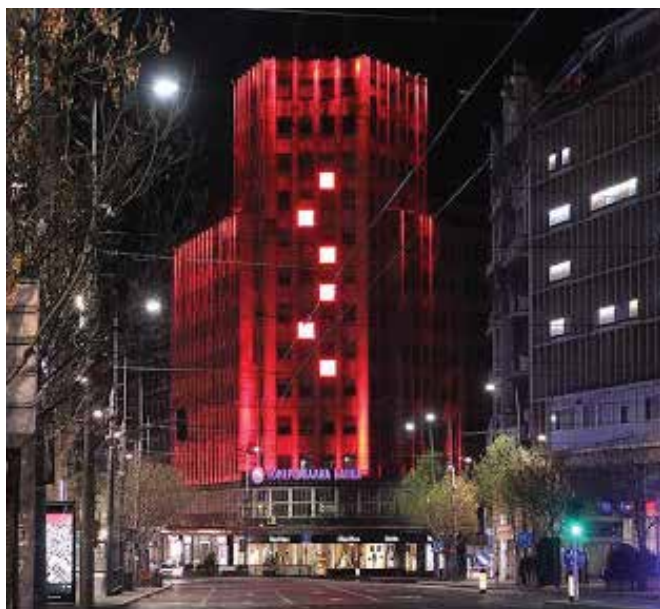
Glavni grad Srbije osvetlio je svoje mostove i ključne zgrade u boju kineske nacionalne zastave kao znak srpske zahvalnosti Kini.

Za sada, Kina nije pokazala vidljivu nameru da naruši proces pristupanja Srbije. Zapravo, verovatno je da bi članstvo Srbije u EU odgovaralo ciljevima inicijative „Pojas i put“ i kineskim ekonomskim interesima; samim tim, ne samo da bi ulazak Srbije i ostatka regiona u EU umanjio administrativne i carinske prepreke, već bi povećao i regionalnu povezanost, olakšavajući na taj način transport kineske robe preko regiona do ostatka Evrope. 32 Stoga ne iznenađuje da je Kina javno podržala EU perspektivu Srbije. 33 Čak i ako bi Kina imala latentnu nameru da poremeti ili uspori proces pristupanja Srbije, poređenje sveukupnog ekonomskog i političkog značaja Kine i EU u Srbiji, pokazuje da bi sposobnost Kine da to učini bila prilično ograničena. Ipak, ako srpski donosioci odluka nastave da preterano ističu svoje kineske partnere u meri u kojoj su to činili tokom pandemije, verovatno je da će Kina ojačati svoju poziciju u Srbiji u budućnosti, potencijalno na štetu EU.