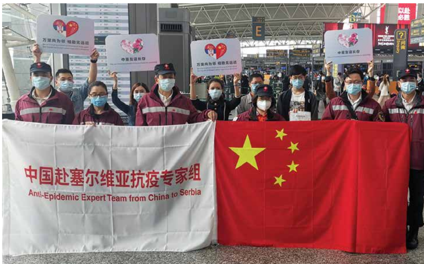
Slika: Kineski antiepidemijski ekspertski tim u Srbiji, 21. mart 2020. godine.