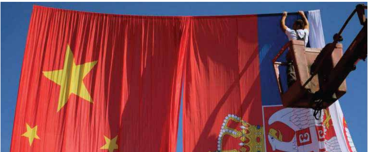
Radnik koji podešava kinesku i srpsku zastavu povodom predstojeće posete kineskog predsednika Si Đinpinga, u Beogradu, Srbija, 16. jun 2016.

Srpski politički odnosi sa Kinom brzo su se razvili nakon proglašenja nezavisnosti Kosova* 1 , usled napora da se smanji njegovo dalje međunarodno priznavanje. Za Kinu je secesionistički potez Kosova* bio neprihvatljiv s obzirom na njenu dugogodišnju politiku vezanu za „Princip jedne Kine“. U tom pogledu, Srbija je u Kini, uz Rusiju, našla značajnog partnera u UN i na globalnom nivou, što do današnjeg dana ostaje najvažnija korist od saradnje sa njom. Činjenica da je Kina označena kao jedan od „četiri stuba“ spoljne politike Srbije 2009. godine od strane bivšeg predsednika Borisa Tadića – zajedno sa EU, SAD i Rusijom – ilustruje koliko je ova veza postala važna za Beograd. 2 Zapravo, ova prioritizacija Kine oličenje je evolucije percepcije globalnih sila od strane srpskog političkog vrha, posebno imajući u vidu da je bivši predsednik Tadić prvobitno predviđao uravnotežene odnose samo sa tri sile – Briselom, Vašingtonom i Moskvom. 3