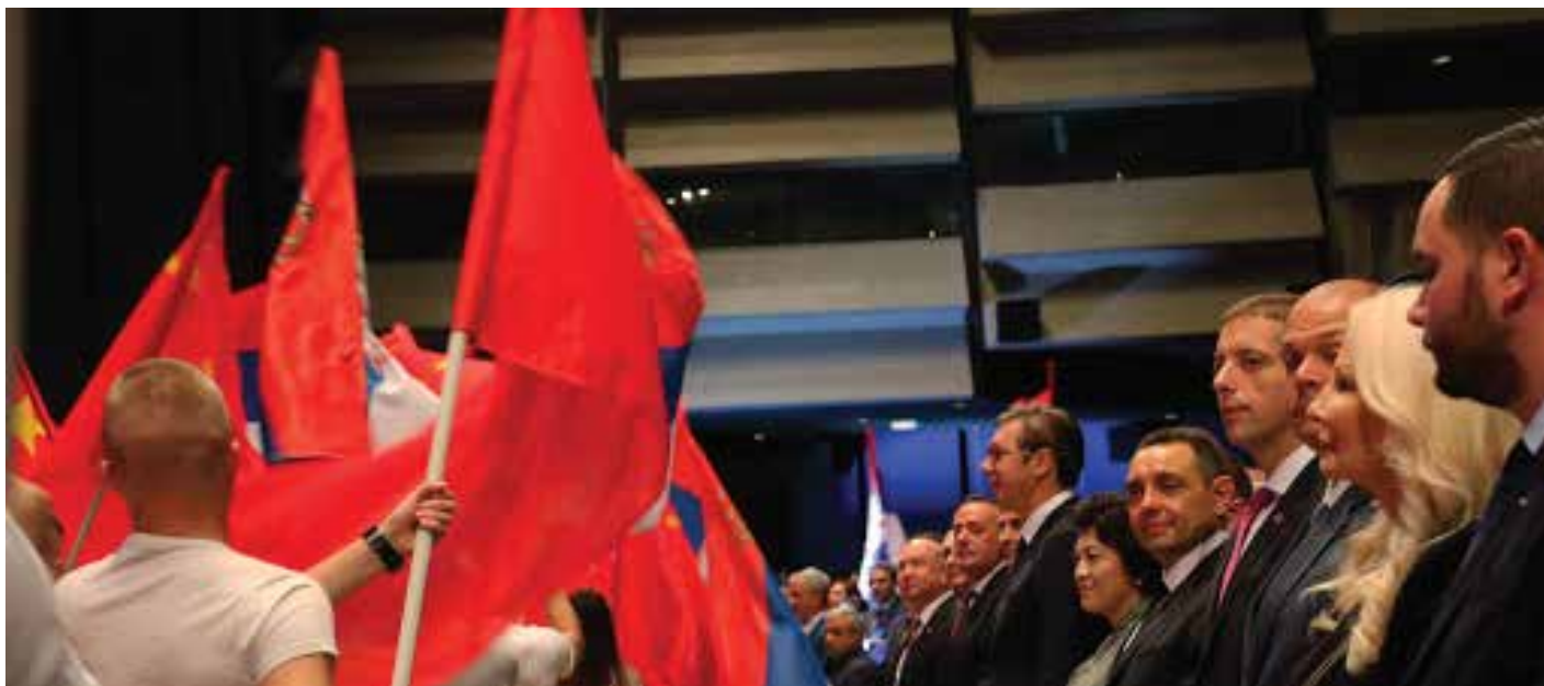
Svečanost sećanja na 70. godišnjicu osnivanja Narodne Republike Kine, simbolično nazvane „Čelično prijateljstvo za zajednički prosperitet“, održane u Sava centru 21. septembra. 2019. godine.

Nezadovoljan nedostatkom brzog odgovora EU u vremenu krize, srpski predsednik Aleksandar Vučić poslao je snažnu poruku javnosti tokom vanrednog televizijskog obraćanja naciji izjavivši: „Evropska solidarnost ne postoji. To je bila bajka.“