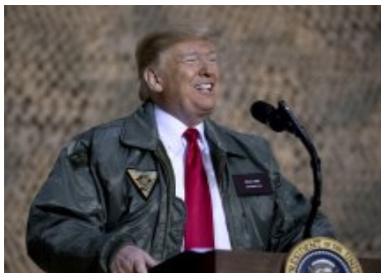
"Imaće novog velikog lidera"