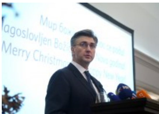
Plenković: Penava ne vodi politiku HDZ