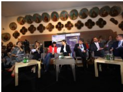
Treći regionalni forum mladih – poruke za Samit u Londonu