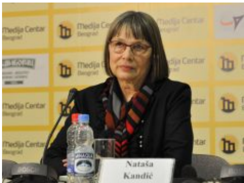
„Zajednička prošlost mora da bude na dnevnom redu Londonskog samita“