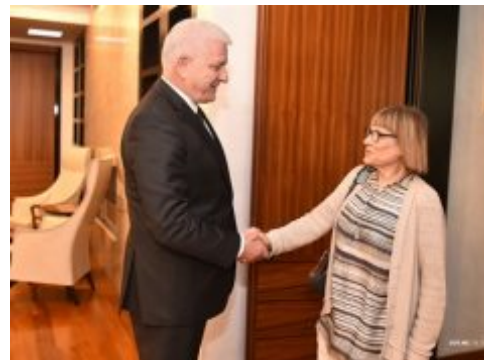
Marković: Učinićemo sve da podržimo REKOM