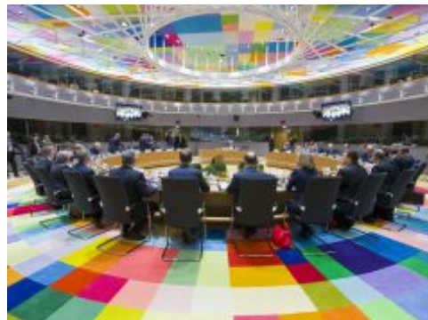
Kocijas: Francuska i Holandija protiv početka pregovora Makedonije i Albanije