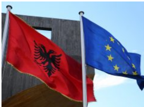
EU: Uslovno otvaranje pregovora za Makedoniju i Albaniju 2019