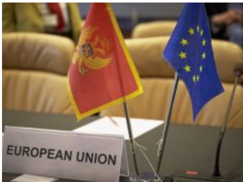
Crnoj Gori ostalo još dva neotvorena poglavlja