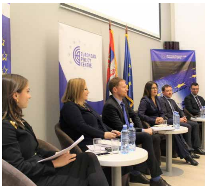
Panel diskusija: Najslabija karika? Mogućnosti i ograničenja civilnog društva kao kontrolora vlasti u procesu pristupanja Srbije EU

CEP je takođe pokazao proaktivan pristup i inicijativu u rešavanju najvećih problema u procesu pristupanja Srbije EU. Organizovane su javne debate i objavljeni radovi na temu transparentnosti i inkluzivnosti procesa pristupanja, u kojima se CEP obraća svim relevantnim akterima: državi, OCD i EU, navodeći savete kako da Unija prevaziđe teškoće u komunikaciji i interakciji, a sa ciljem da obezbedi transparentniji, na dokazima zasnovniji pristup. Dodatno, CEP-ovi istraživači su nastavili da analiziraju aktuelne teme, kao što je izbor