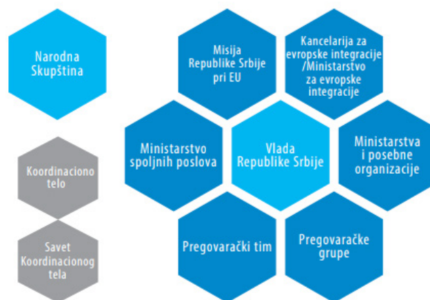
Slika 2. Institucionalna interakcija u praksi

Uprkos ovoj negativnoj činjenici, nalazi ukazuju na veoma visok nivo institucionalne saradnje i povezanosti različitih tela uključenih u pristupni proces, a samim tim i u proces zastupanja interesa u EU. Čini se da analizirane institucije, ali i njihovi zaposleni, dele istu viziju o putu Srbije ka EU i ideju o tome na koji način lobističke aktivnosti u Briselu treba da se sprovede. Posledično, oni nastupaju „jednoglasno“, što im mahom omogućava usaglašenu poziciju na nivou EU. S obzirom da je Srbija pokazala zadovoljavajući nivo institucionalnog i kadrovskog kontinuiteta, predstavnici Srbije stekli su poverenje i poštovanje evropskih zvaničnika, što u praksi često predstavlja preduslov za uspešnu formalnu, a posebno neformalnu komunikaciju u Briselu. Iz tog razloga evropski zvaničnici do ovog trenutka nisu imali nikakve zamerke kada je u pitanju način na koji je pregovaračka struktura Srbije funkcionisala. Činjenica da relevantna tela deluju u skladu sa svojim nadležnostima određenim normativnim okvirom, i imaju veoma dobar zajednički nastup, u velikoj meri vraća sistemu ravnotežu i funkcionalnost sistemu.